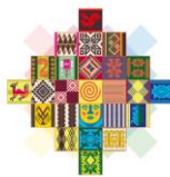
Tabla N° 1